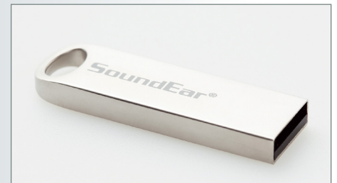
USB-Stick zum Auslesen der Daten